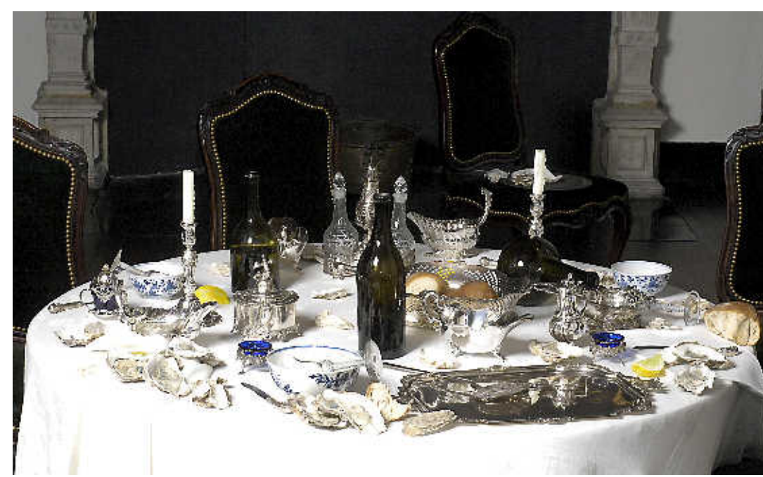
Op een schilderij geïnspireerd: de restanten van een overvloedige oestermaaltijd.

Andere kunstenaars van wie bezoekers werk tegenkomen op hun 'parelrouten' door het museum, zijn onder anderen Erwin Olaf, Rineke Dijkstra, Berend