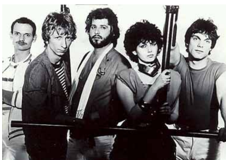
Tower in de jaren tachtig.

„Die andere bandjes hebben nooit het succes van Tower geëvenaard. En het publiek is Tower blijkaar nooit vergeten. Edwin Evers wierp anderhalf jaar geleden op de radio de vraag op welk bandje uit de jaren tachtig de luisteraars graag zouden terug zien. De meeste stemmen waren voor Tower. Het wakkerde ook de belangstelling aan van Fonos, een bedrijf dat oude lp's omzet naar cd's. Dat hebben ze ook